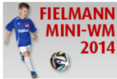
Fielmann-Mini-WM Jetzt für die Startplätze bewerben!