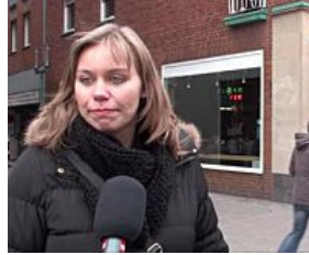
Umfrage: Wo kann man in Münster am besten feiern?