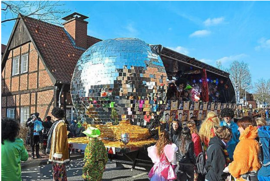
Mehr ein Gesamtkunstwerk, denn ein Karnevalswagen: Der Ka-Ki-V-Motto-Wagen wurden beim Grevener Umzug als schönster Wagen ausgezeichnet.