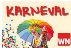
Karneval Närrisches Treiben in der Region! Helau!