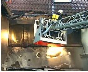
Subway-Filiale in Münster brennt aus