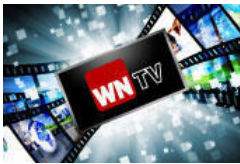
WN-TV Videos aus MS und der Region.