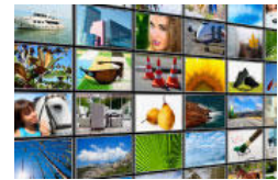
WN-Fotos Aktuelle Fotos aus MS und der Region.