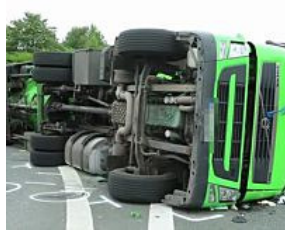
Schwerer Unfall auf der Umgehungsstraße