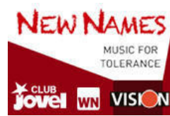
New Names Wir bieten jungen Bands Auftrittsmöglichkeiten